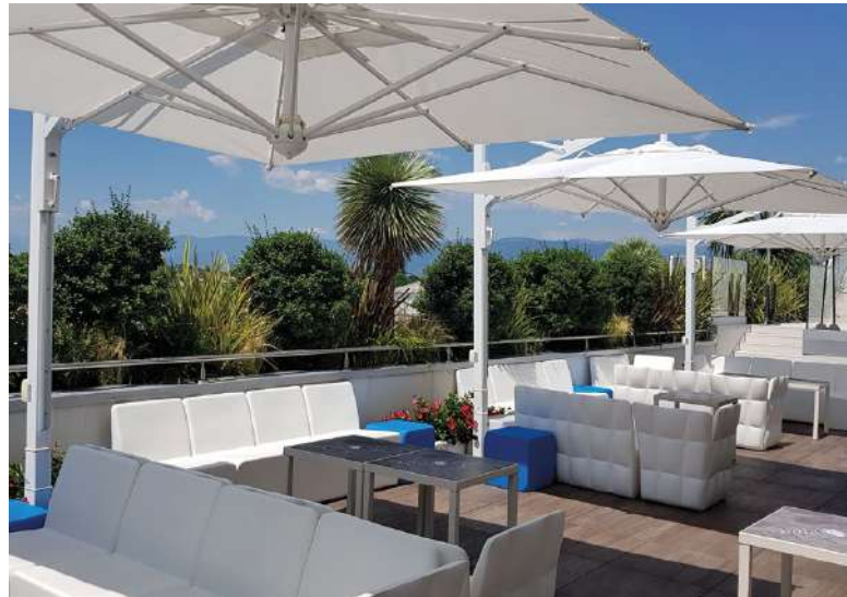
TERRAZZA MOVIDA CASTIGLIONE DI LORIA - TREVISO