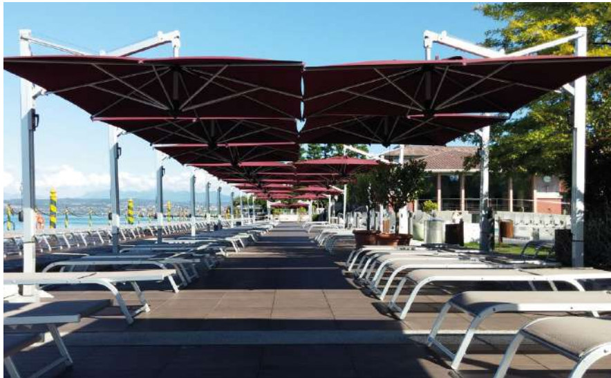
TERME DI SIRMIONE- BRESCIA